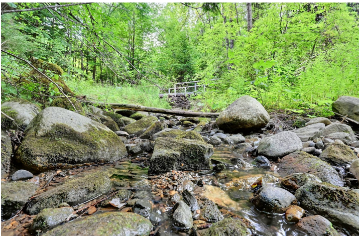
Accès au plan d'eau