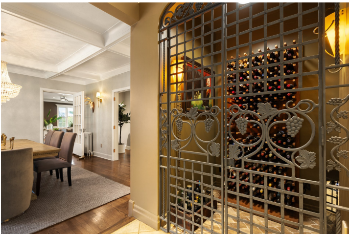
Cave à vin