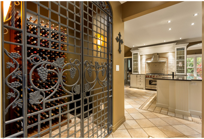
Cave à vin