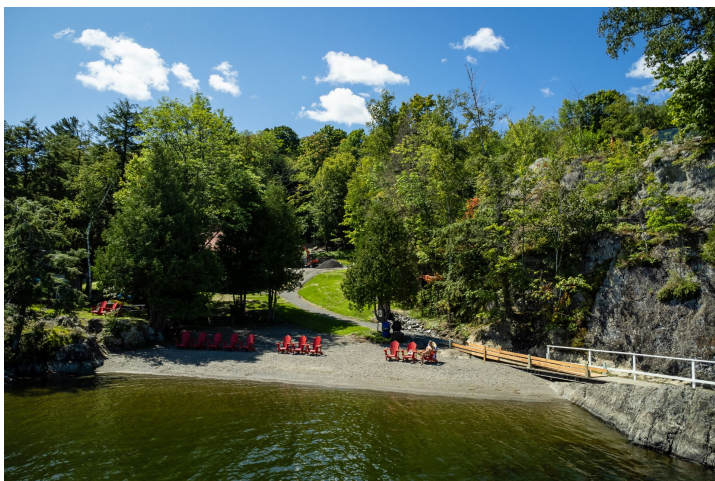
Accès au plan d'eau