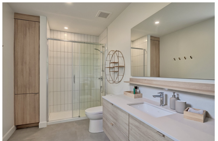
Salle de bains attenante à la CCP