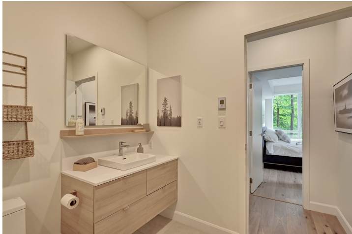
Salle de bains attenante à la CCP