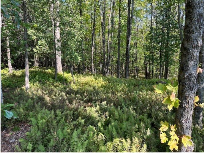
Terre à bois