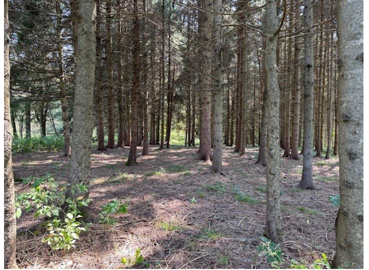
Terre à bois