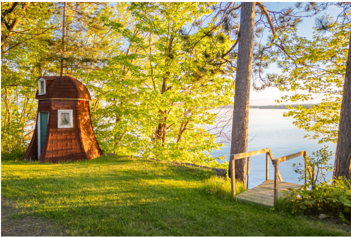
Accès au plan d'eau