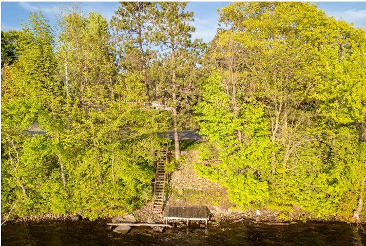
Accès au plan d'eau