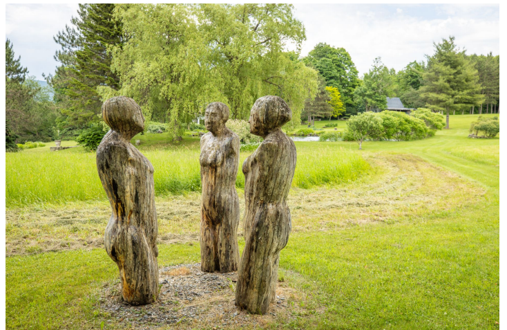
Bureau des secrétaires