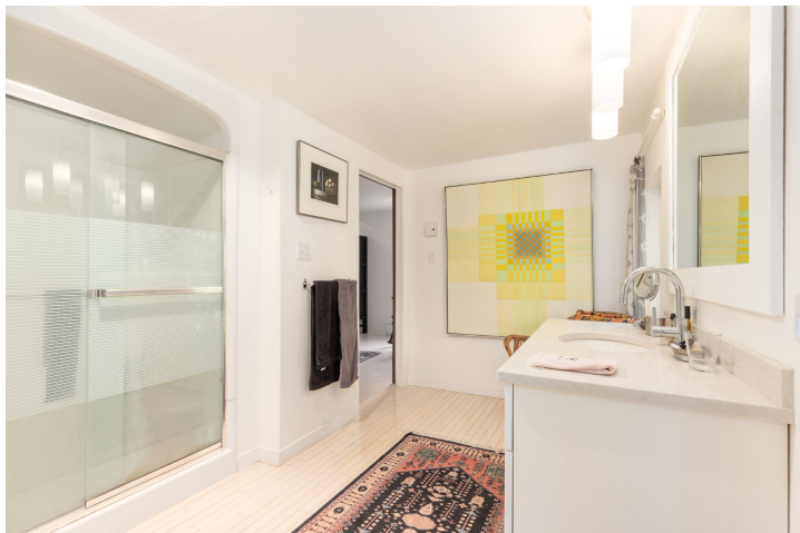
Salle de bains attenante à la CCP