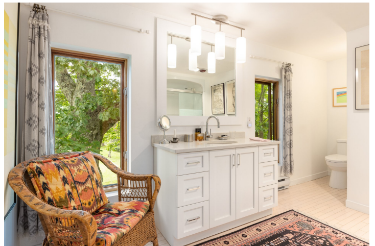
Salle de bains attenante à la CCP