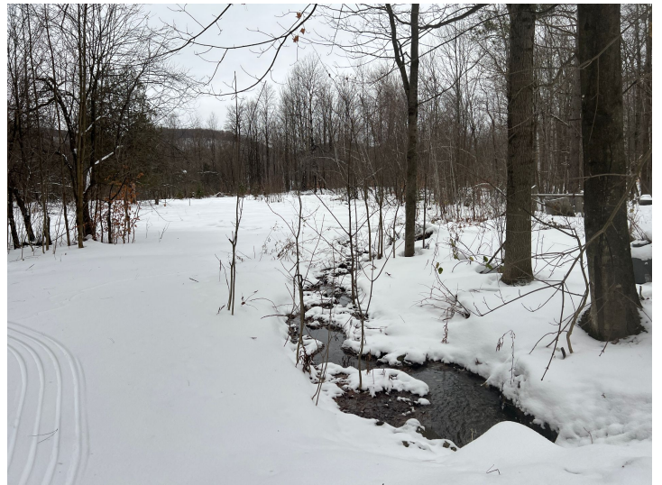
Terre à bois