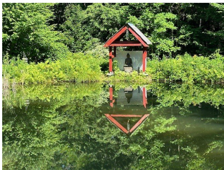
Vue sur l'eau