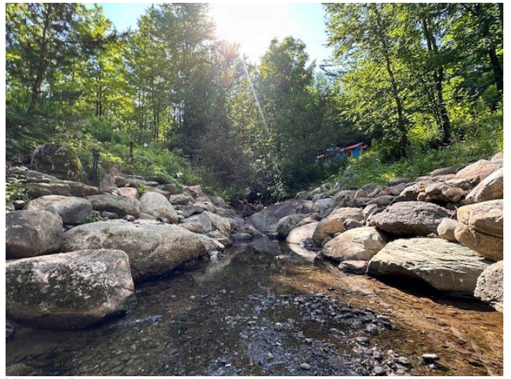
Vue sur l'eau