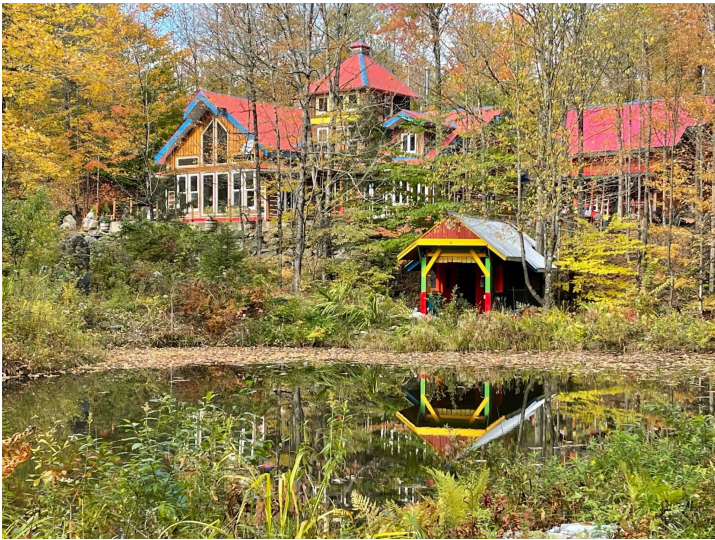
Vue sur l'eau