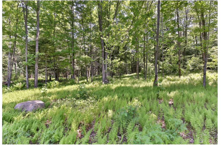
Terre à bois