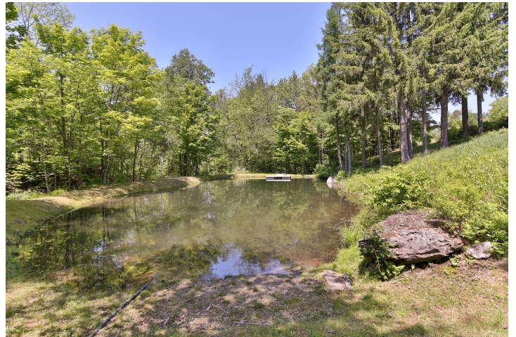
Accès au plan d'eau