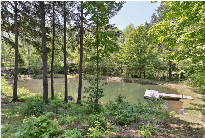
Accès au plan d'eau