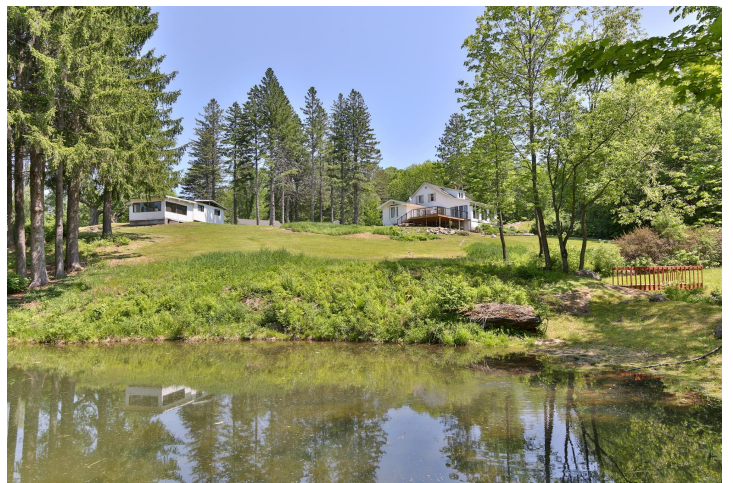
Vue sur l'eau