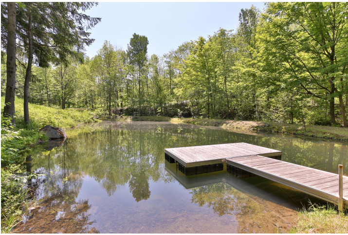
Accès au plan d'eau