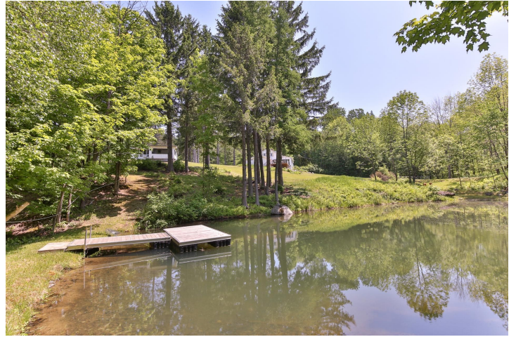
Accès au plan d'eau