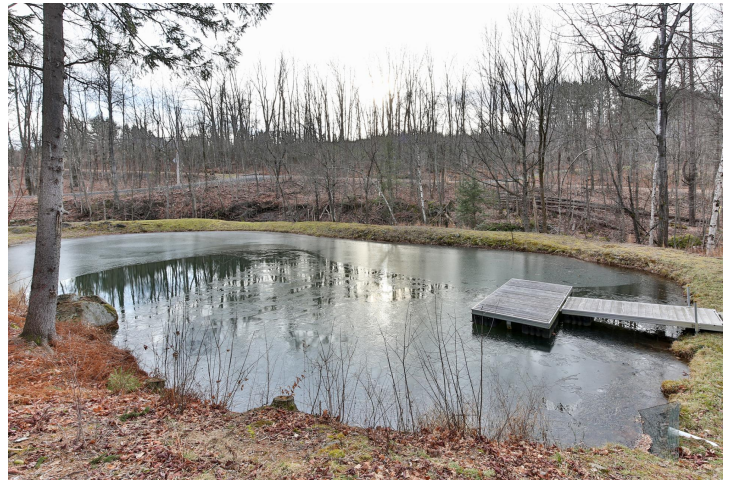
Vue sur l'eau