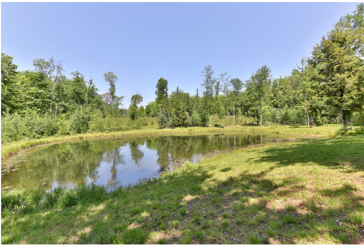
Accès au plan d'eau