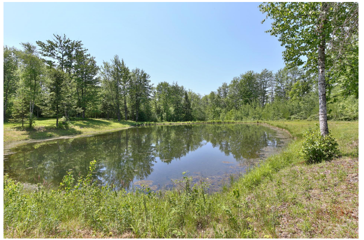
Vue sur l'eau